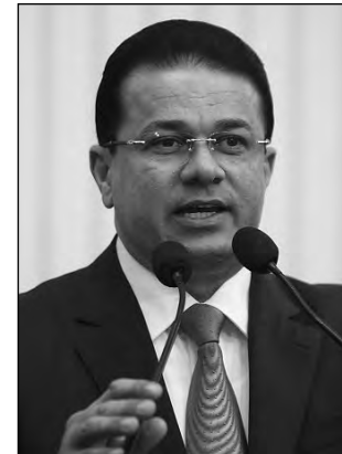
ADALTO - Direito garantido

A ação conjunta da Vigilância Sanitária, Procon-PE, Ministério Público de Pernambuco e Delegacia do Consumidor, que vem notificando e até interditando estabelecimentos comerciais e supermercados de grande porte no Recife, mereceu destaque do deputado Adalto Santos (PSB) na tarde de ontem, na Casa Joaquim Nabuco.