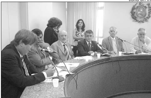
ADMINISTRAÇÃO - Crédito superior a R$ 200 milhões