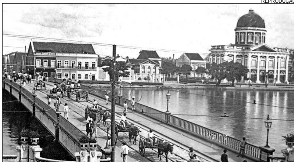
OBRA - Palácio (d) tornou-se prédio oficial da AL em 1875. Sede foi concluída um ano depois

O edifício sede do Poder Legislativo de Pernambuco, inicialmente denominado Paço da Assembléia, só começou a ser construído em 1870. Localizado na Rua da Aurora, bairro da Boa Vista, no Recife, às margens do Rio Capibaribe, o projeto é assinado pelo major do Corpo de Engenheiros e bacharel em Ciências Físicas e Matemática José Tibúrcio Pereira de Magalhães. A obra foi entregue, provisoriamente, no dia 21 de novembro de 1874, porque ainda faltavam alguns