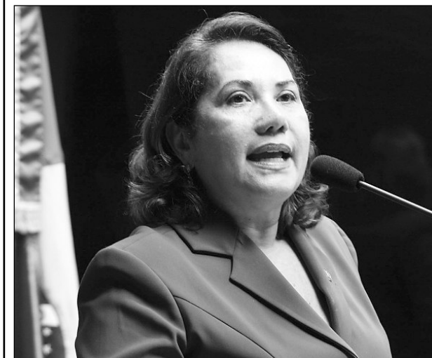
ARTE - Deputada pediu reunião para os 100 anos do artista

portância do artista para Caruaru - município onde nasceu, em 10 de julho de 1909 - para Pernambuco e também para o País. "Ele é um ícone da cultura popular. Por causa da sua arte, o Brasil também foi divulgado no exterior. É mais do que justa uma homenagem para o mestre", pontuou. Miriam ainda pediu aos demais parlamentares da Casa Joaquim Nabuco que aprovem, por unanimidade, a matéria. O evento poderá ocorrer no dia 4 de junho. Vitalino faleceu no ano de 1963, aos 54 anos.