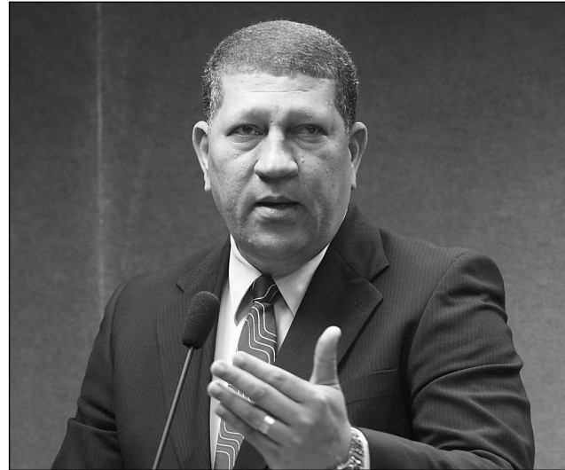
ISALTINO - Líder disse que Estado melhorou com Eduardo

Já a deputada Terezinha Nunes (PSDB) afirmou que o avanço na Educação do Estado foi lembrada na mensagem com dados de 2006, quando a gestão era do ex-governador Jarbas Vasconcelos (PMDB). A tucana contes-