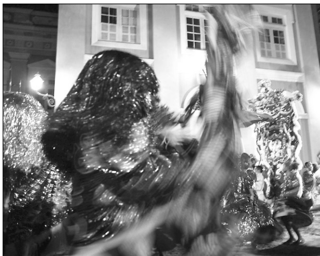
BRILHO - Maracatu encantou público presente ao evento

Durante cerca de uma hora, os artistas adiantaram para o público que prestigiou o evento o que será mostrado aos foliões no Carnaval