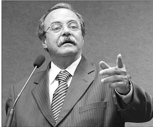
EURICO - "Governo esqueceu questões fundamentais"

Além disso, ainda segundo o parlamentar, a mensagem deixou de re-