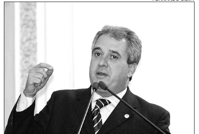
COUTINHO - Proposta estabelece o bem-estar social

sujeitos a várias penalidades, entre elas o pagamento de multa que varia de R$ 500,00 a R$ 5 mil, interdi-