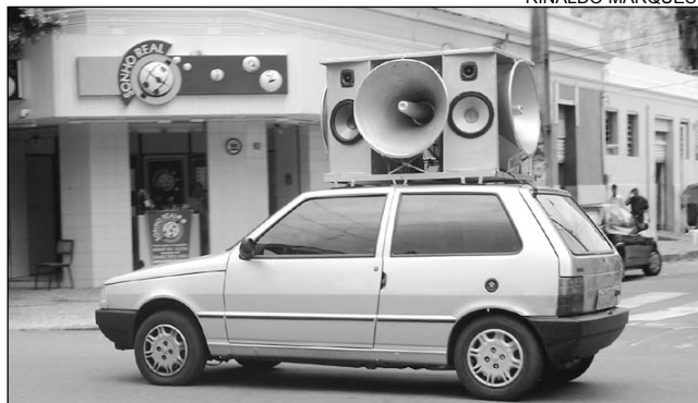
VEÍCULOS - Penalidades para sons acima de 50 decibéis

Assembleia Legislativa de Pernambuco. A matéria foi regulamentada pelo Poder Executivo, no dia 4 de novembro.