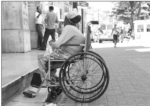
ESTACIONAMENTO - Reserva de vagas especiais

outubro de 2005. O não-cumprimento acarretará multa que varia de R$ 2 mil a R$ 100 mil.