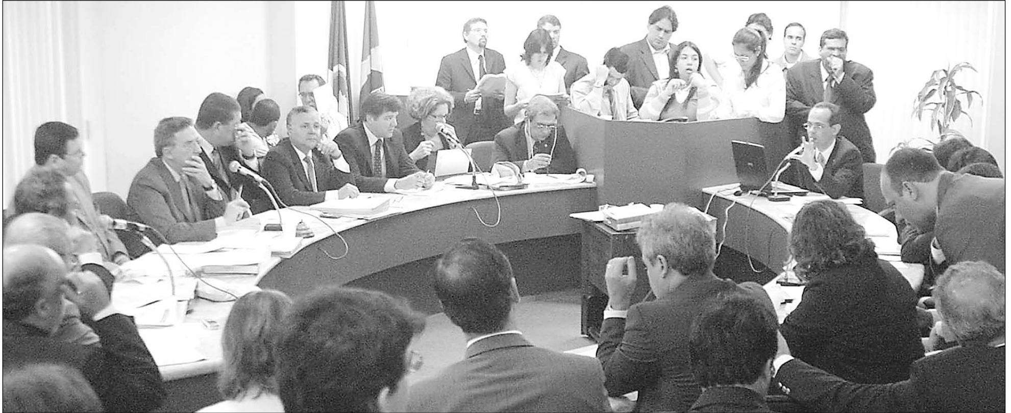
FUNCIONALISMO - Proposta que tratou do Plano de Cargos, Carreiras e Vencimentos dos servidores do Tribunal de Justiça motivou diversos debates com representantes da categoria