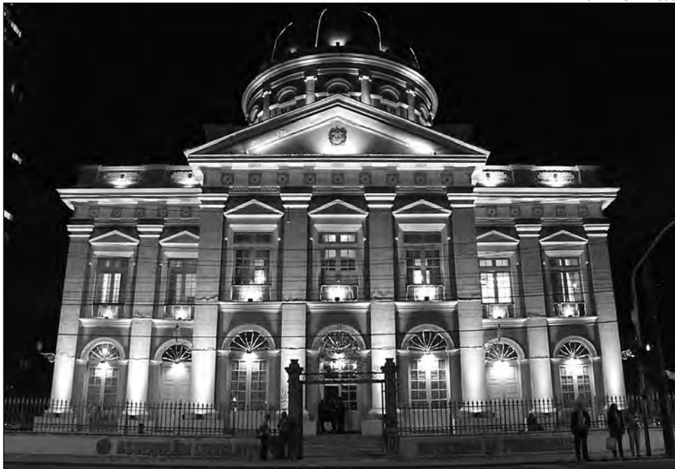
SEDE - Colunas e cúpula do Museu Palácio Joaquim Nabuco serão ornamentadas