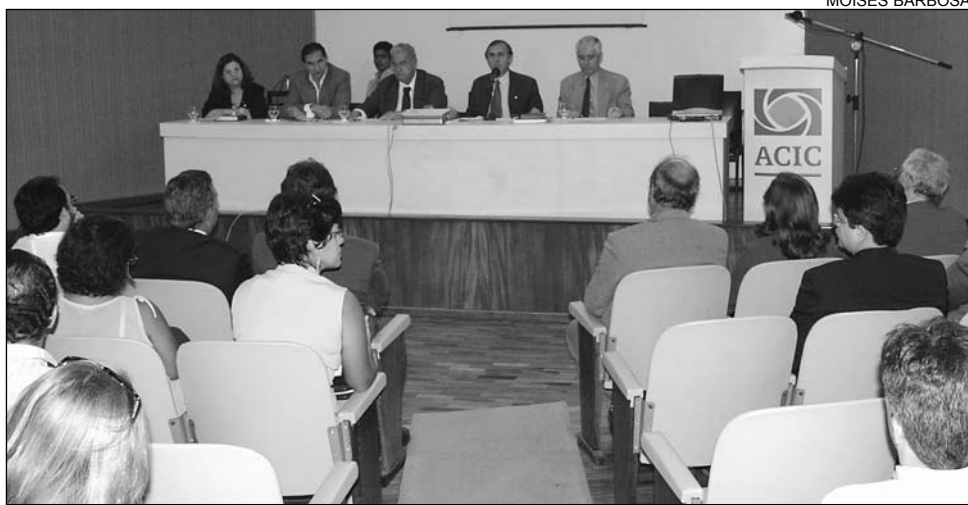
PERNAMBUCO - Apenas 15,9% dos jovens entre 18 e 24 anos estão nas universidades