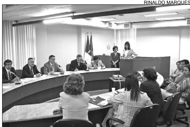
RECURSOS - Obra custará cerca de R$ 4,7 milhões

slides mostrando como ficará o centro. A unidade será formada pelos Centros de Atendimento Socioeducativo (Case), Centro de Internamento Provisório (Cenip) e terá blocos de segurança e proteção, além de área de lazer, com quadra de esportes, local para prática de agricultura, entre outros.