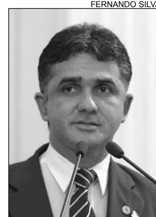
SALÁRIO - "Valor baixo"

"Um fato novo foi registrado, a renovação dos contratos. Mesmo assim, ainda existem outros problemas. Além do trabalho exercido nas unidades prisionais, os GETs prestam serviços no Regimento da Polícia Montada e no Hospital da PM", declarou o parlamentar acrescentando que a categoria é qualificada para atuar na segurança pública e, por isso,