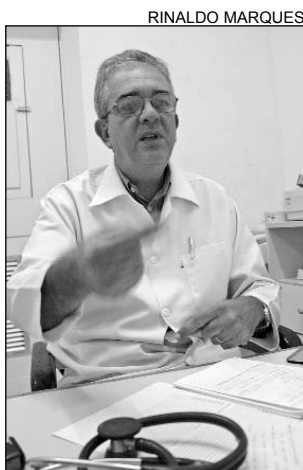
MOURY - Importância

Além disso, a Assessoria de Saúde realizará