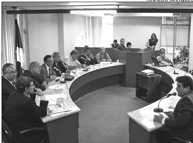
AUDIÊNCIA - Secretário esteve na reunião de Finanças

No total, o Orçamento prevê recursos na ordem de R$ 12,6 bilhões, valor 12% maior que o reestimado para 2006. Em relação às receitas correntes, espera-se uma arrecadação de ICMS de R$ 5,1 bilhões, representando um crescimento de 11% em relação a este ano, e os repasses do Fundo de Participação dos Estados (FPE) devem ficar em aproximadamente R$ 2,4 bilhões, um aumento de 9%. Nas despesas correntes, R$ 353 bilhões serão destinados para o pagamento