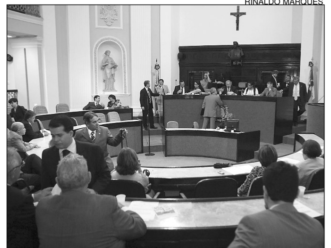
HIERARQUIA - Antiguidade e mérito serão avaliados

Para o integrante do Democratas, “a medida gerará sérias insatisfações na tropa, uma vez que abre margem para interferências políticas”. “A alteração atingirá três cargos que atuam diretamente nas ruas. Com policiais insatisfeitos, a segurança pública poderá ser prejudicada”, avaliou, sugerindo que as vagas destinadas à promoção sejam 30% por merecimento e 70% por