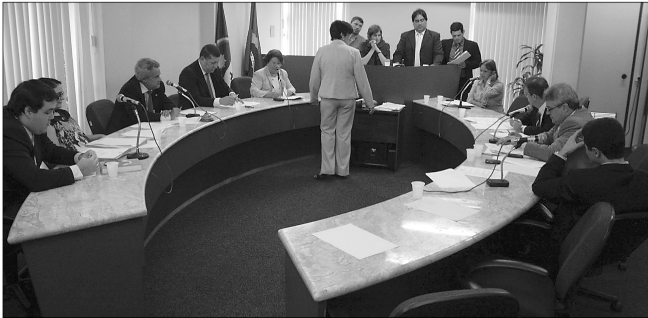
VOTO - Matéria foi acatada durante encontro ordinário da Comissão de Constituição, Legislação e Justiça da Alepe