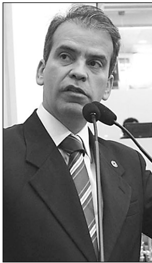
FEITOSA E PEREIRA - Fiscalização em centros esportivos

O parlamentar é autor do Projeto de Lei nº 879/08, obrigando estabelecimentos esportivos, públicos ou privados a contratar profissio-