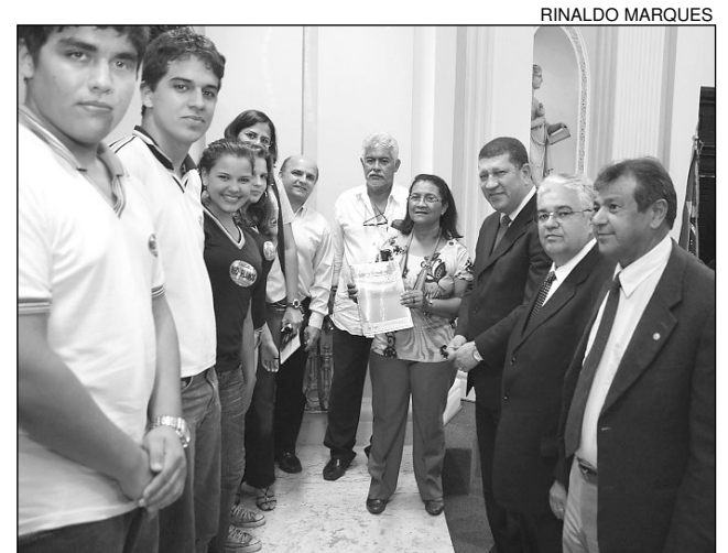
PLENÁRIO - Estudantes e deputados com objetivo comum