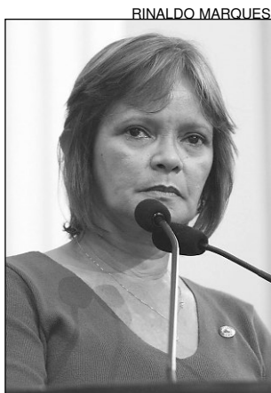
NADEGI - Risco constante

No discurso, elogios à iniciativa do Real Hospital Português (RHP) por realizar, em 29 de agosto, data em que se celebra o Dia Nacional de Prevenção ao Fumo, uma campanha de combate ao tabagismo, na Praça do Diário, no bairro de Santo Antônio. “O fumante passivo pode adquirir todas as doenças do ativo, por isso, a sociedade precisa se engajar na luta contra o cigarro”, pontuou.