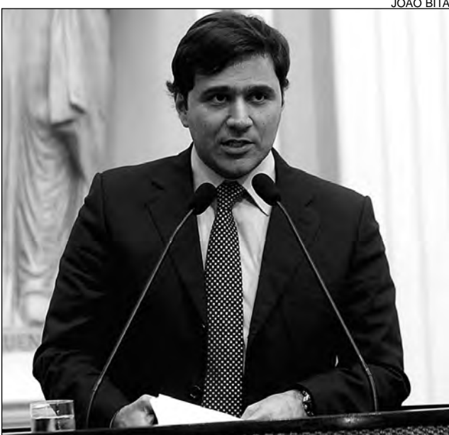
OPORTUNIDADE – Novaes citou exemplo implantado em SP