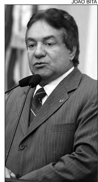
ANÁLISE – Izaías Régis

O parlamentar registrou agradecimentos ao governador do Estado, às secretarias de Governo, às Polícias e à imprensa pernambucana por colaborarem com a iniciativa. “O turismo é a maior indústria mundial. A visão do Governo do Estado em incentivar o entretenimento é uma forma de alavancar a economia das localidades”, avaliou.