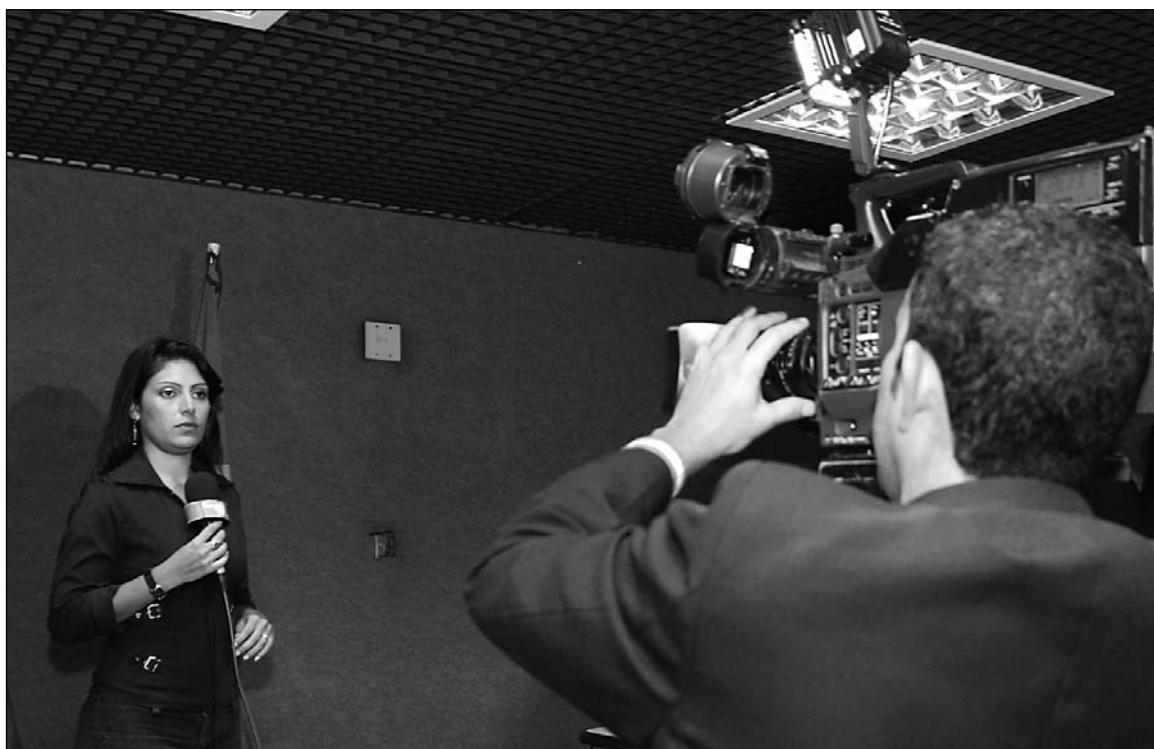
PROGRAMAÇÃO - Equipe de Jornalismo já está mostrando as ações da Casa Joaquim Nabuco

Com transmissões também ao vivo para a Região Metropolitana do Recife (RMR), a Assembléia na TV , segundo afirmou Uchoa em discurso, é a ferramenta principal da transparência legislativa. "A divulgação ampla das atividades do Parlamento confere credibilidade à instituição. É um mecanismo constante de prestação de contas de nossa atuação como representantes do povo", ponderou o presidente da Casa, para em seguida acrescentar: "Pelo compromisso com os pernambucanos,