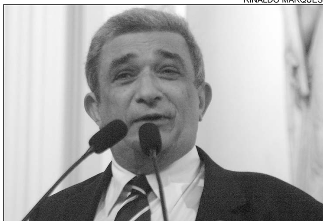
APOIO - Peemedebista recebe as boas-vindas e agradece