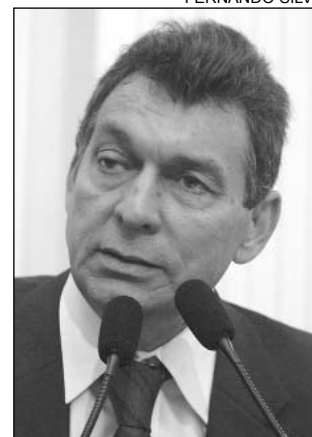
NÉLSON - Líbano

O estopim da atual crise de violência foi o seqüestro de dois soldados israelenses, no último dia 12 pelo Hizbollah. Desde então, Israel ataca o Líbano.