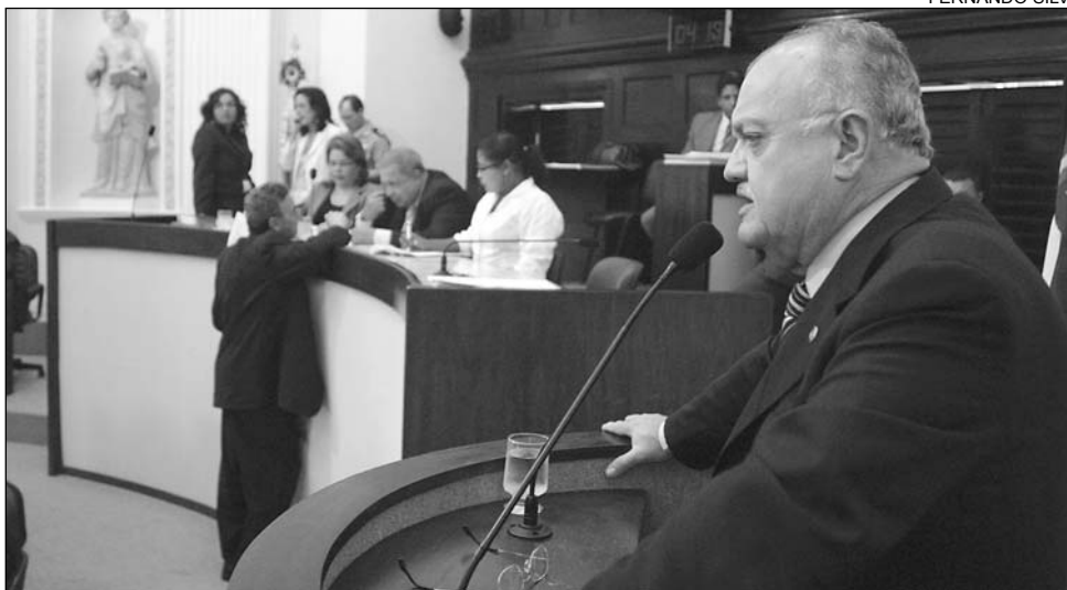
VIOLÊNCIA - Aumento da criminalidade na região metropolitana preocupa deputado