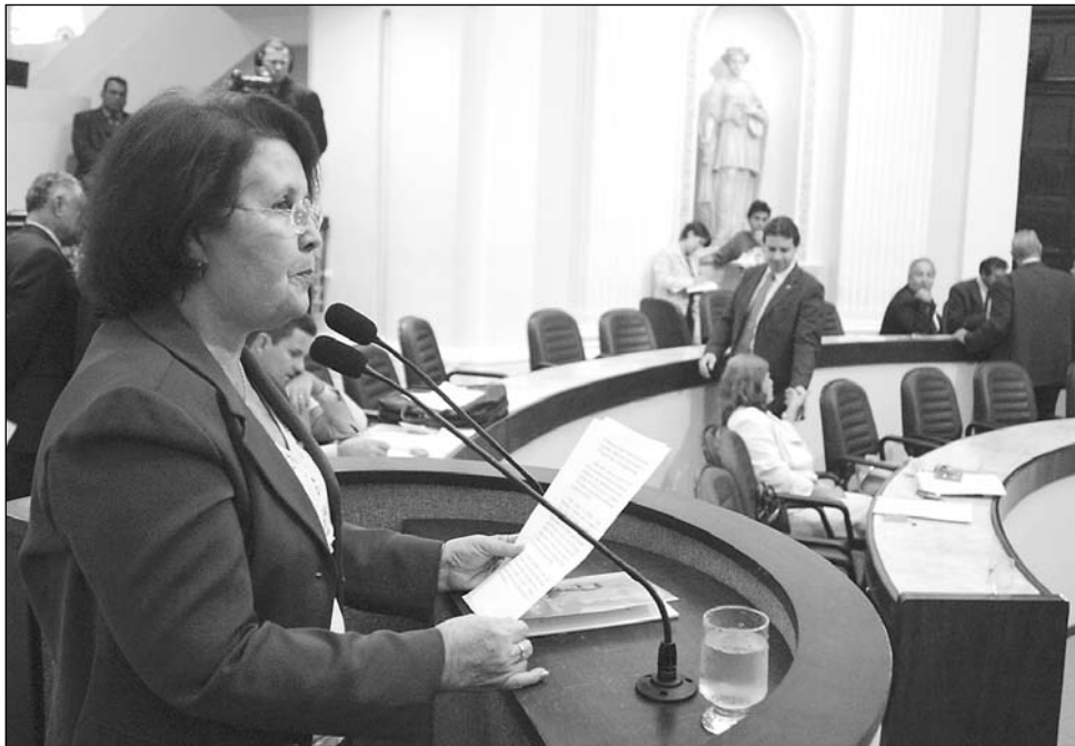
ATUAÇÃO - Pároco fundou a Escola Dom Bosco, no bairro de Peixinhos, em Olinda