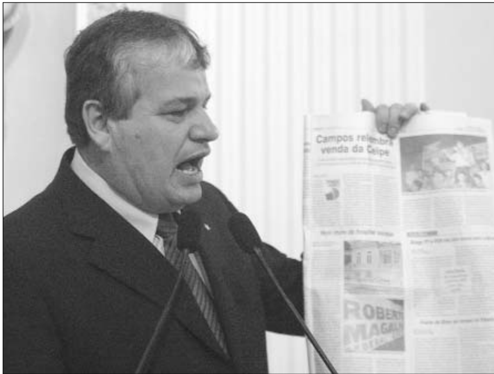
ENTREVISTA - Assassinatos aumentaram na gestão de Braga, segundo parlamentar

O petista duvidou dos dados apresentados por Braga na matéria. "Falta transparência no Executivo e ninguém sabe ao certo os verdadeiros números da violência no Estado", acusou, acrescentando que, durante a ges-