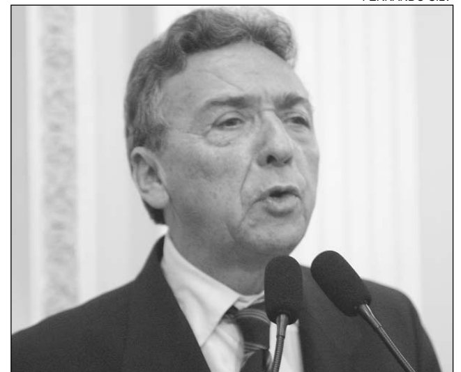
QUEIROZ - Pedetista acusa uso da máquina pública

Para o pedetista, é preciso distinguir ações políticas das administrativas. "Os prefeitos não