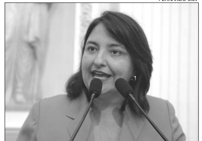
SERIEDADE - Progressista citou necessidade dos veículos

da sede e de três outros distritos. Por dia, os veículos transportam entre 30 e 40 pessoas ao Recife para tratamento de saúde. "Todos os carros foram comprados por meio de licitação e seguiram os trâmites exigidos por lei", detalhou. "Gostaria que os prefeitos e governadores tivessem o mesmo cuidado que o prefeito de Cumaru tem com os habitantes da localidade."