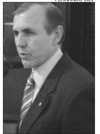
LIBERATO - Gratidão

Segundo Liberato, durante a passagem na cidade, Mendonça Filho ainda teve a oportunidade de presenciar um congresso de saúde promovido pela Prefeitura de Caruaru. Durante o pronunciamento, o parlamentar também parabenizou o deputado Geraldo Coelho (PFL) pelo trabalho em defesa do desenvolvimento da educação em Petrolina, no Sertão do Estado.