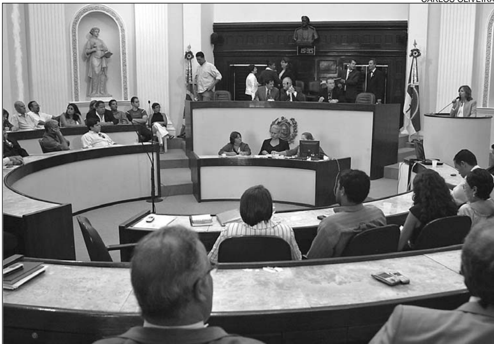
PLENÁRIO - Evento reuniu deputados e representantes de diversas instituições