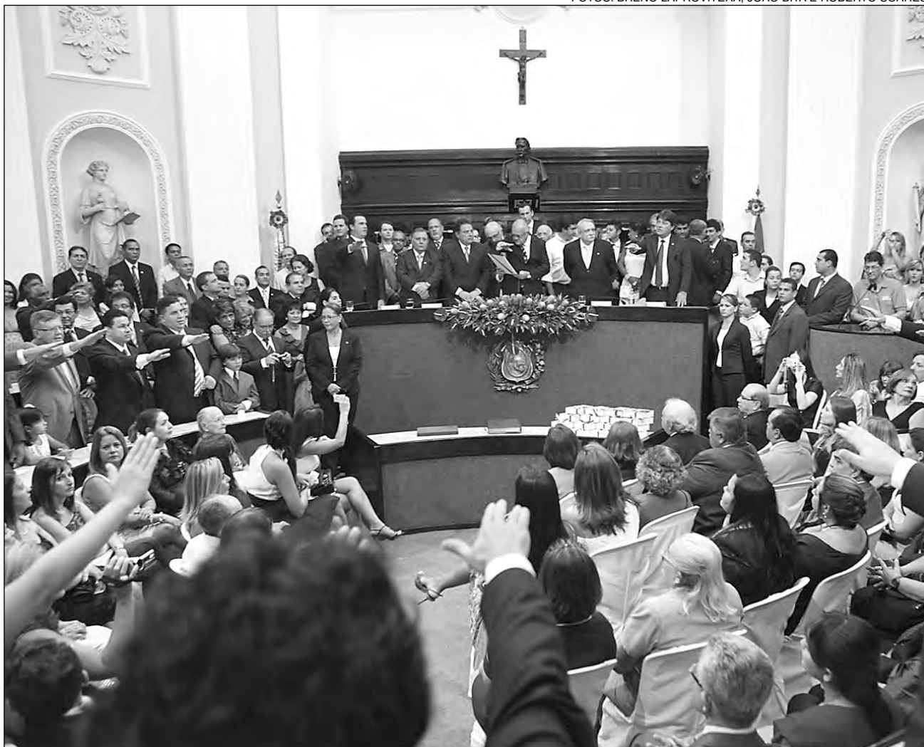
JURAMENTO - Parlamentares eleitos pela sociedade em outubro de 2010 prometeram honrar Constituição Estadual