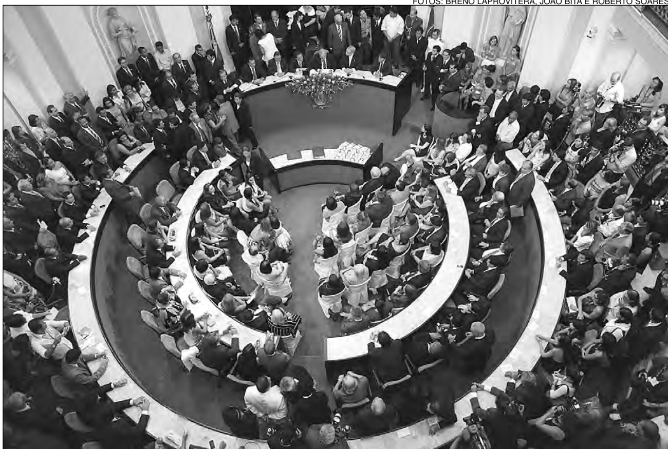
PRESTÍGIO - Eleitos juraram honrar e cumprir o que determina Constituição de Pernambuco em prol da sociedade