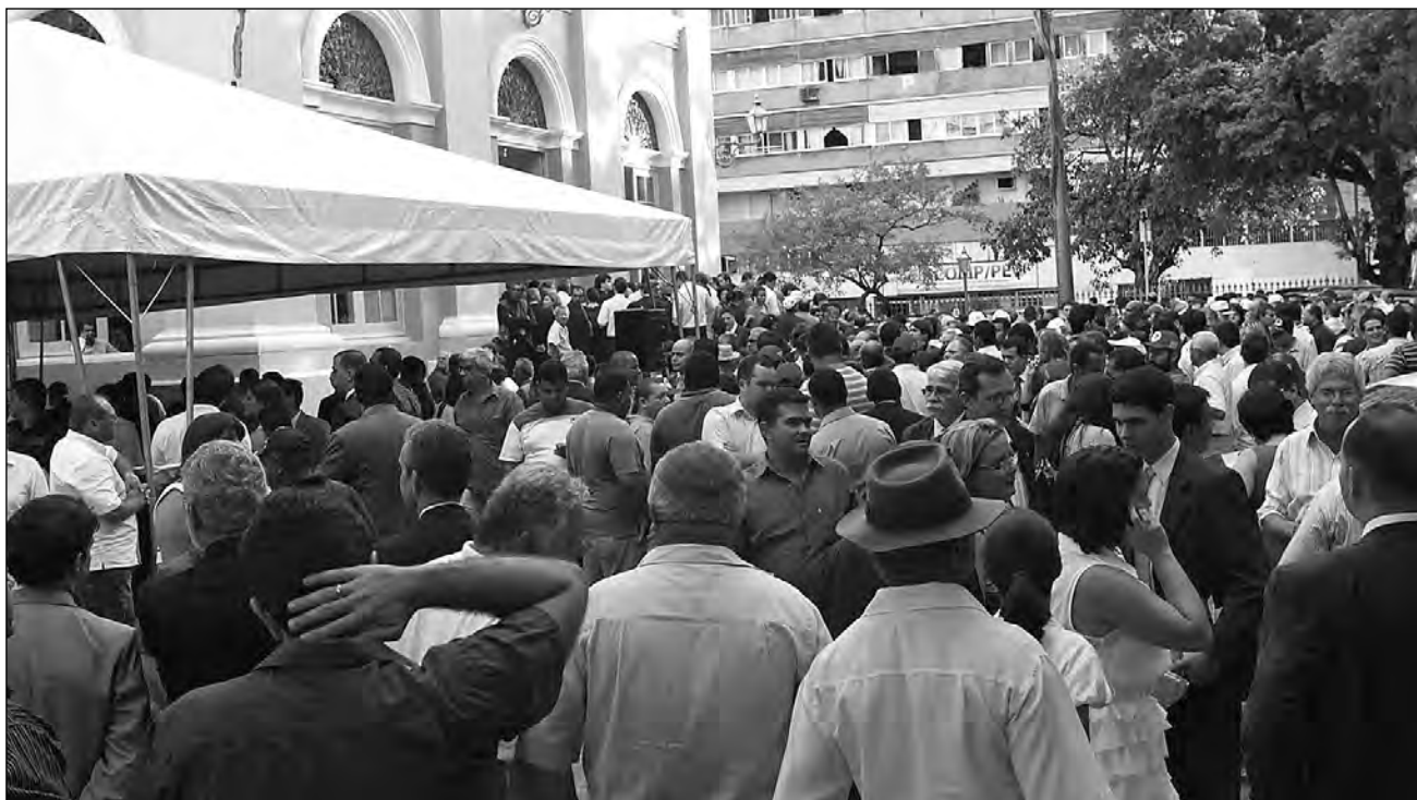
PÁTIO - No lado externo da Casa, muitos convidados acompanharam evento em telão instalado para ocasião