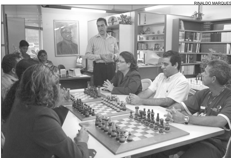
JOGO - Aulas para os funcionários com o presidente da Federação Pernambucana de Xadrez

Recife, quinta-feira, 2 de fevereiro de 2006