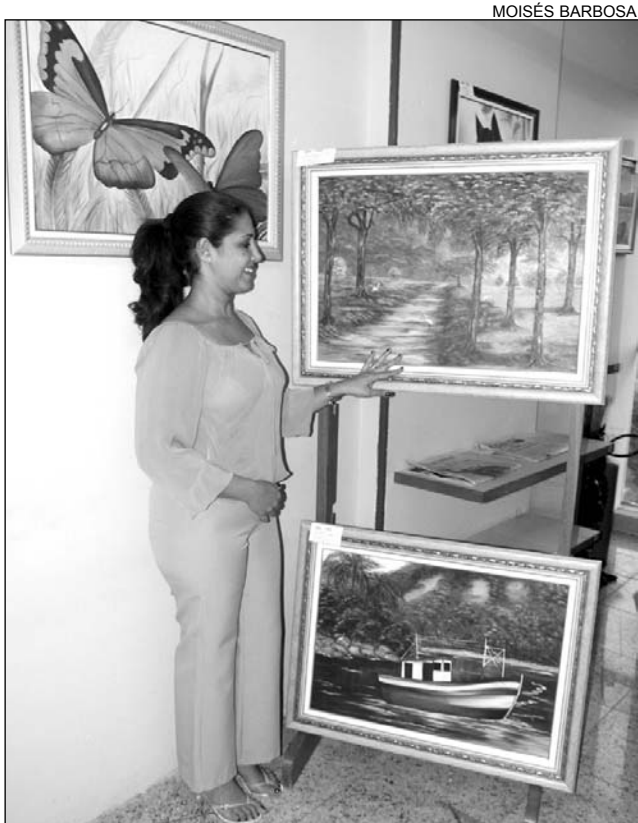
PINTURA - Exposições com o trabalho de diferentes artistas

Incentivar a leitura e informatizar o acervo são alguns dos projetos para este ano