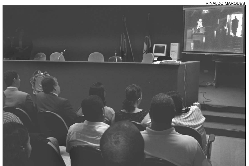
CINETECA - Filmes nacionais e internacionais todas as segundas-feiras, na hora do almoço