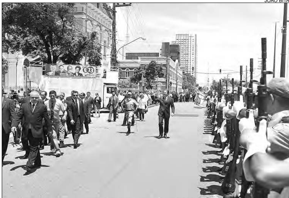
REVISTA - Eduardo Campos deixa a Alepe a caminho do Palácio para governar até 2014