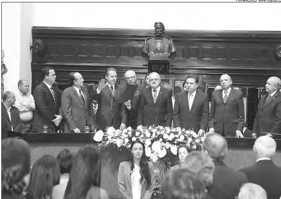
JURAMENTO - Governador Eduardo Campos (PSB) reafirmou compromisso constitucional