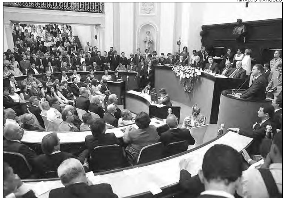
DISCURSO - "A Alepe tem importância fundamental na consolidação do desenvolvimento"