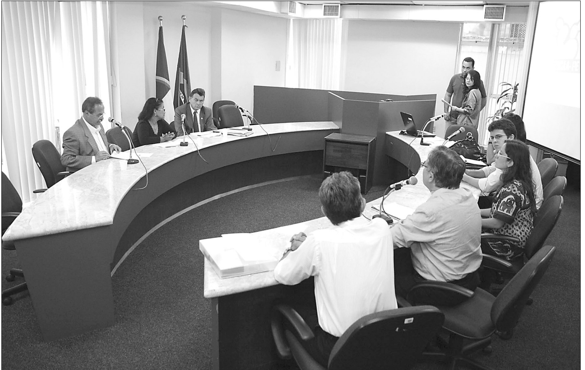
FALTA DE INFORMAÇÃO - Parlamentares e técnicos abordaram necessidade de orientar gestores públicos sobre esse recurso, uma vez que muitos desconhecem