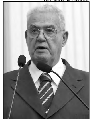
COELHO - Vitória