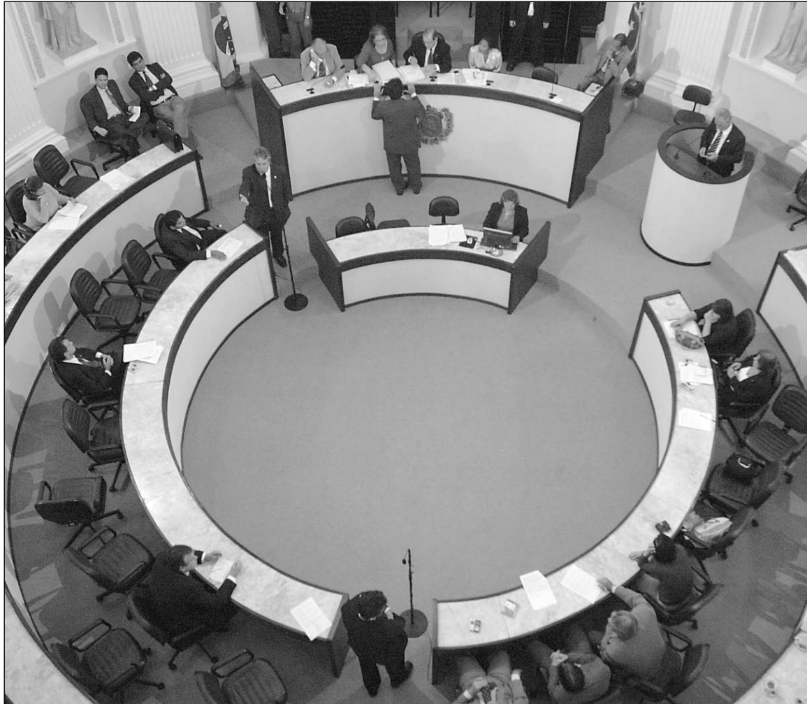
SUCESSÃO - Período eleitoral não prejudicará votação de matérias nem promoção de debates

Romário disse que a campanha eleitoral não prejudicará os trabalhos na Casa. "Montamos