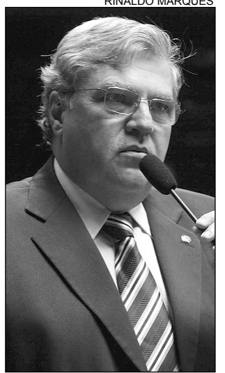
APLAUSOS - Queiroz

O parlamentar também defendeu a aprovação de dois projetos de sua autoria. As proposições consideram o Carnaval de Vitória de Santo Antão e o Sítio Histórico Monte das Tabocas, localizado no mesmo município, como Patrimônio Cultural e Im-