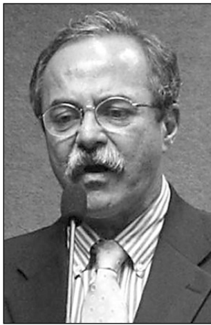
EURICO E ALVES - Críticas e defesa à ação do Exército

Eurico citou diversos episódios do regime ditatorial, como, quando à época do golpe, o então governador do Estado, Miguel Arraes, recusou-se a deixar o Palácio do Campo das Princesas pelas portas dos fundos, negando-se também a se entregar às Forças Armadas por discordar politicamente da administração que se estabelecia. Instalou-se, no País, um período de medo