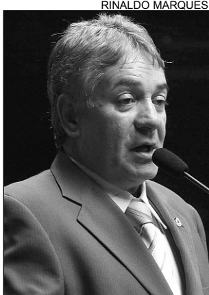
RÉGIS - Entusiasmo

A cada noite, cinco canções serão escolhidas entre as 15 que concorrerão entre si, e, no domingo, acontecerá a grande final. Os cinco primeiros colocados recebe-