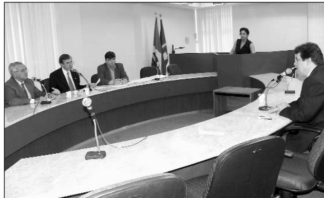
INCENTIVO - Artistas têm direito a verbas para produzir