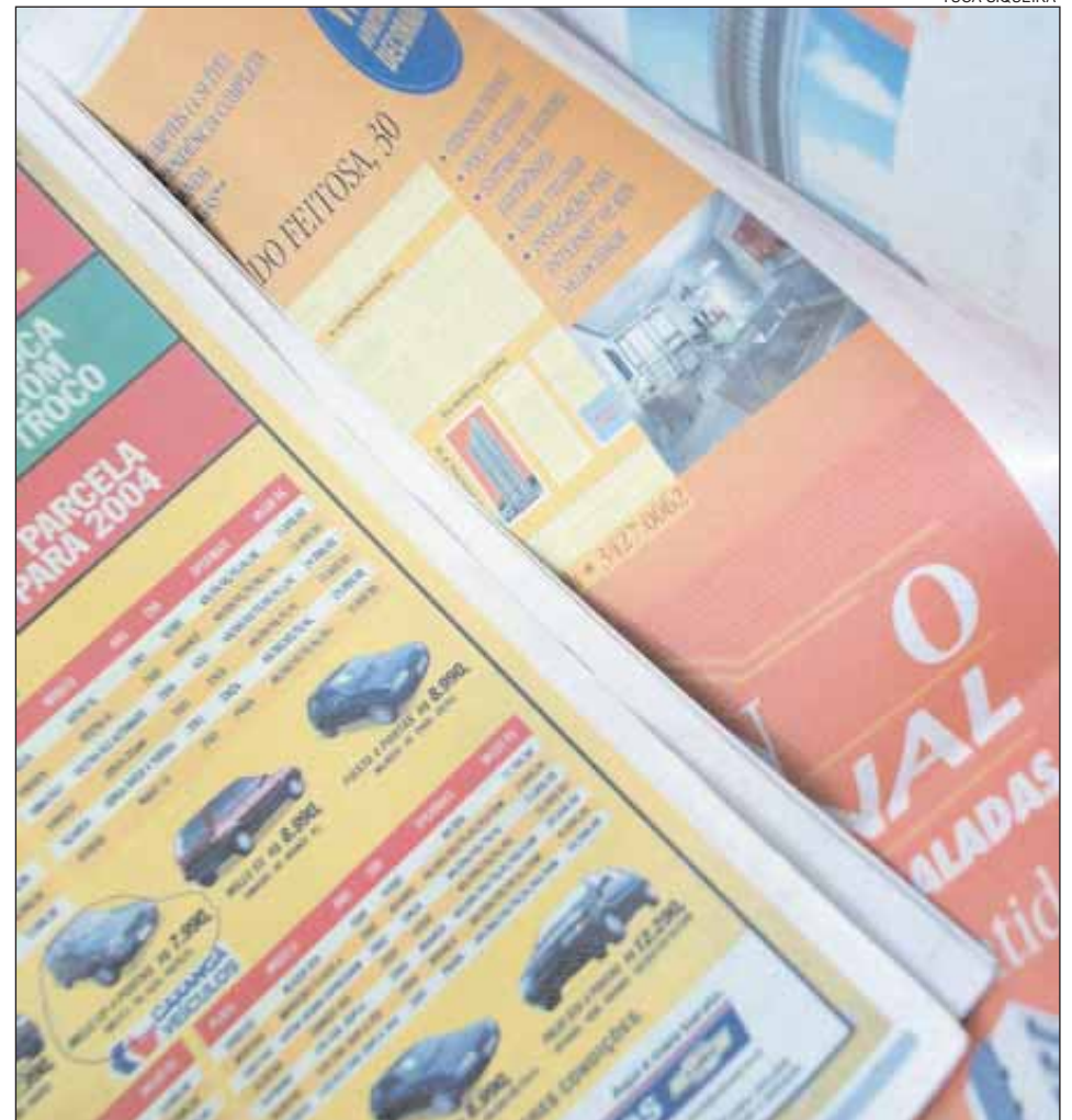
Jornais velhos serão destinados a empresas que trabalham com reciclagem