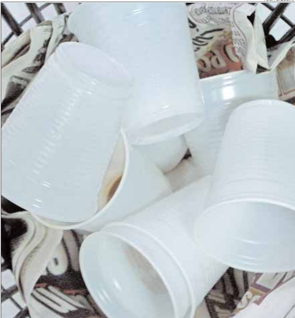
Coleta seletiva vai aproveitar copos plásticos descartados diariamente