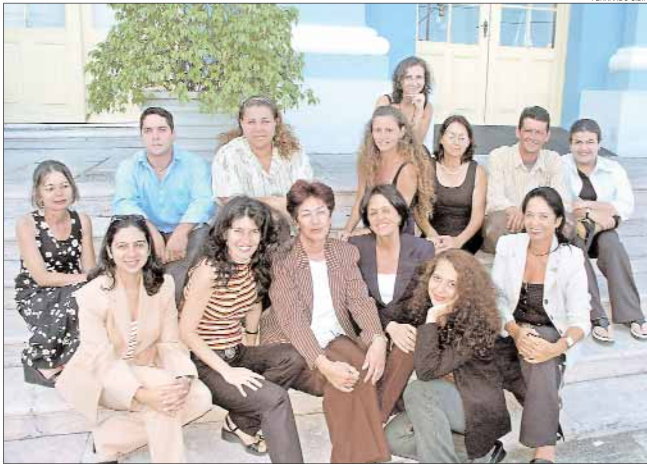
Funcionários foram selecionados por comissão julgadora do Concurso de Poesia Austro Costa