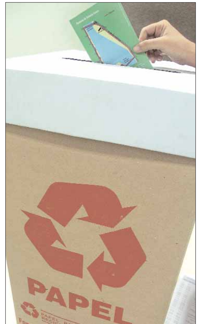
Alguns setores já fazem recolhimento de papel

Proposta foi apresentada, no mês passado, à Comissão de Defesa do Meio Ambiente por alunas da UPE