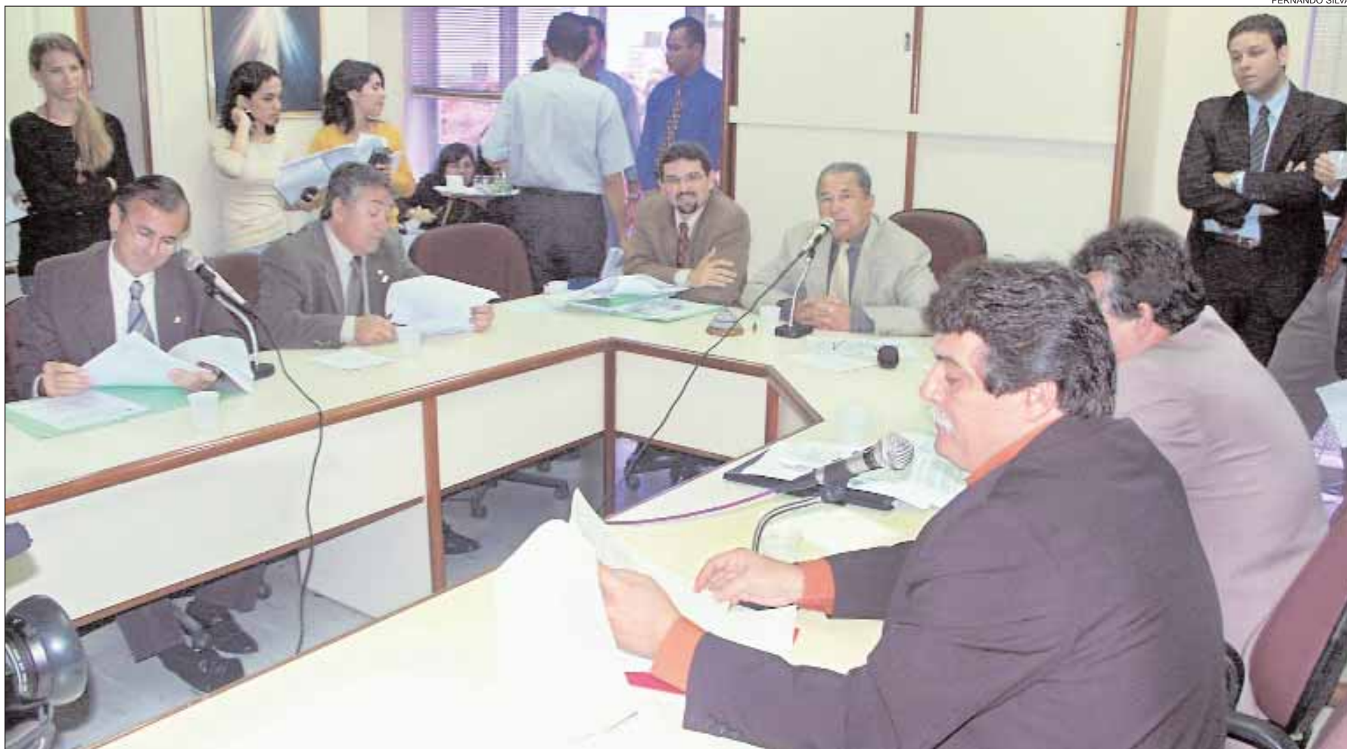
Integrantes da Comissão de Finanças, Orçamento e Tributação deram início à análise do projeto, que deverá ser votado em Plenário, no próximo dia 27