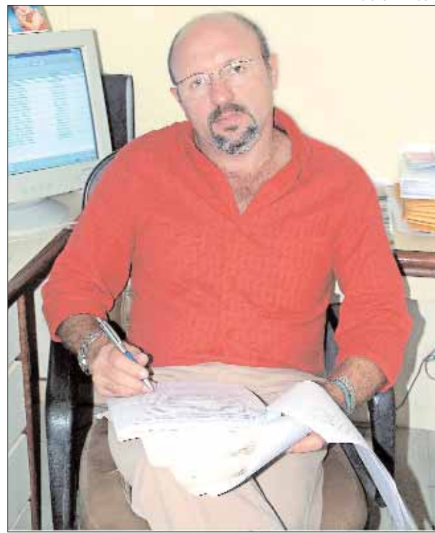
Trabalho vai resgatar memória da Assembléia