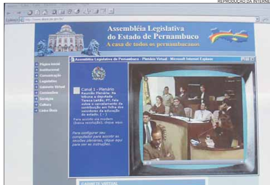
REPRODUÇÃO DA INTERNET

Se o visitante da Infonordeste quiser fazer uma "viagem no tempo", a Alepe disponibilizará, ainda, o Acervo Histórico do Período Imperial, composto de Atas do Senado, Anais da Assembléia Provincial, Anais do Senado do Império, Leis Provinciais, Leis do Império do Brasil e Falas da Assembléia Provincial.