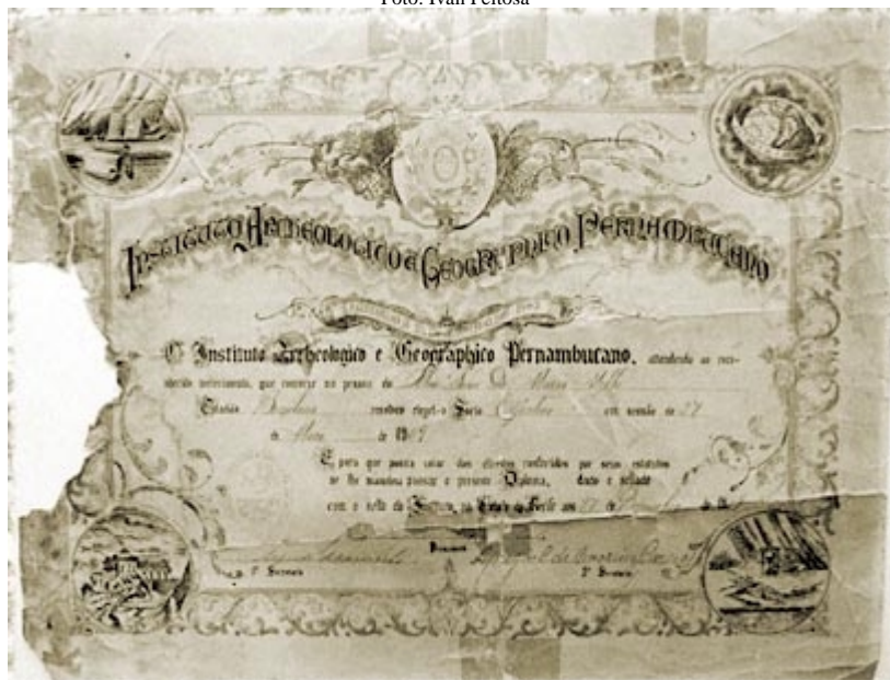
Diploma de Sócio Efetivo do Instituto Arqueológico, Histórico e Geográfico Pernambucano - 1909.