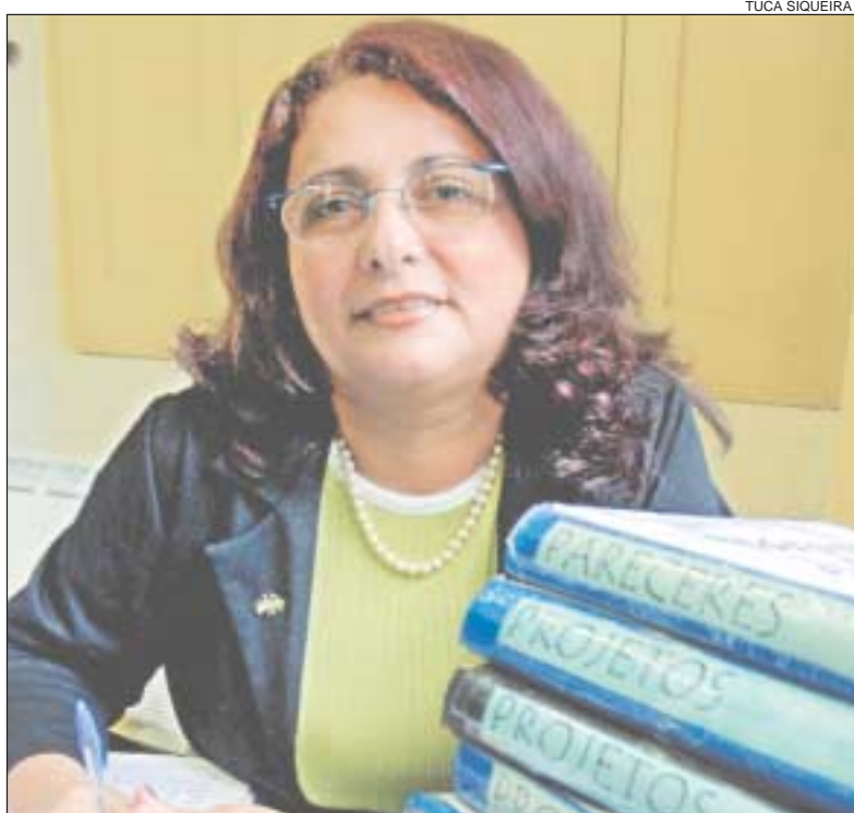
Funcionária tem como hobby ir ao cinema e viajar com a família