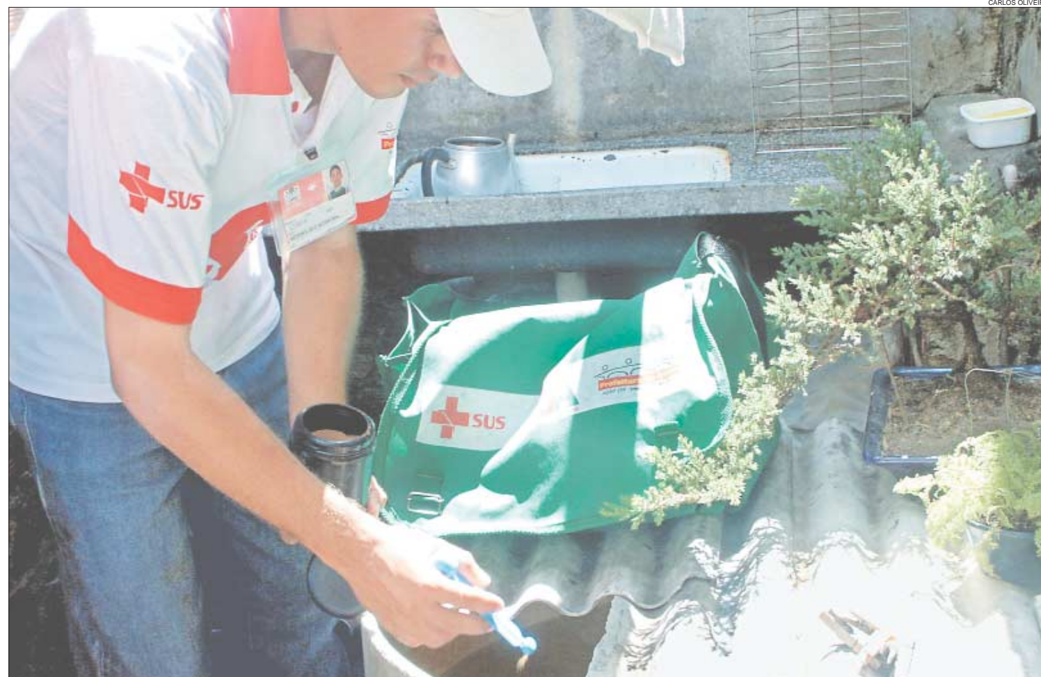
Uma das medidas que beneficiam a população estabelece regras para o acesso de agentes sanitários a residências, visando combater focos do mosquito da dengue

Entre as propostas que ainda tramitam na Casa, está o Projeto de Lei nº 73/2003, do deputado Bruno Rodrigues, instituindo nas redes pública e privada de ensino o estudo da dependência química e o Programa Permanente de Orientação e Prevenção ao Uso de Drogas.