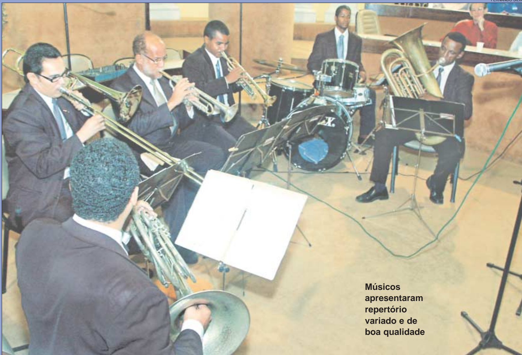
Músicos apresentaram repertório variado e de boa qualidade